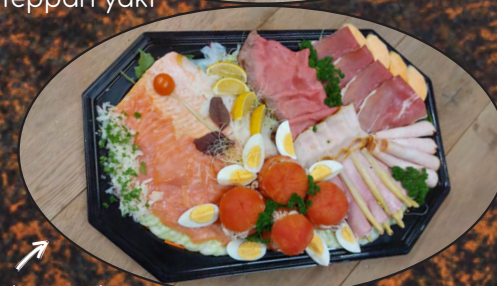
Vis en vlees